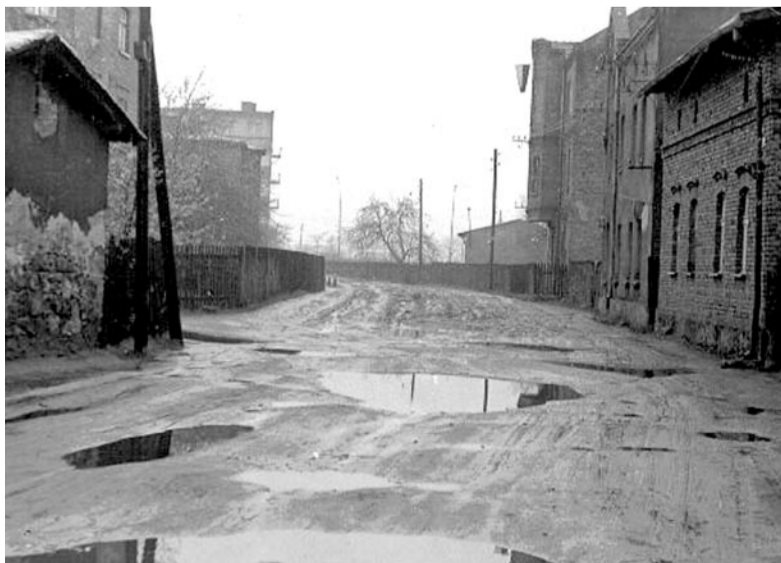
WJAZD NA UL. ŻURAWIĄ. CZERWIEC 1969 R.