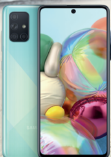
Samsung Galaxy A71